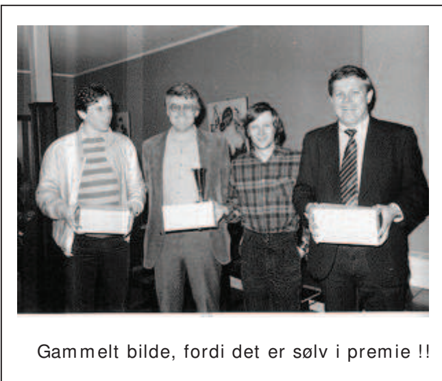
Gammelt bilde, fordi det er sølv i premie !!